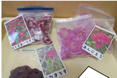
保護者さんより、ゆりぐみの草木染の素材として「花びら」を！