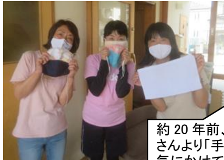
約 20 年前、三室戸保育園時代に卒園された保護者さんより「手作りマスク」を！20 年経っても法人の事を気にかけてくださるお気持ちに感激です！