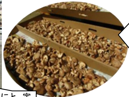
京北の椎茸農家・清水様より大量の「椎茸」を！

新型コロナウイルス感染症の感染拡大防止に、ご理解・ご協力をいただき本当にありがとうございます。こんな遊びがあるよ！こんな活動したよ！等の発信をすることで、ご家庭での遊びのヒントになったり、話の話題になったりと、少しでもお家で過ごす時間のお役にたてればと考えています。離れていても一緒！下記の QR コードを読み取りして、是非遊びにきてください