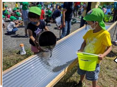
「バイバーイ！」「大きくなってな～！」と言葉を掛けながら、稚魚を優しく流していました。郷土愛が育まれる貴重な体験となりました！