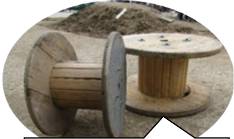
保護者さんより遊び環境の素材として「糸車」を！

新型コロナウイルス感染症で騒がれているこのご時世の中で「園で使ってください！」「園でいかがですか？」と、保護者さんや、地域の方等様々な方々より寄付いただきました。温かな気持ちに感謝し、大切にに使わせていただきます。