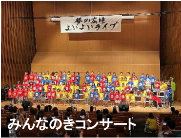
みんなのきコンサート

午前の部はみんなのきコンサート。みんなのき三室戸・しゅしゅ・Hana・黄檗・三山木の年長児が一堂に会し、『とうさん かあさんへ』の合唱と、各施設の職員による『あそびやさん』を楽しみました。 午後の部は、コロナ禍を経て4年ぶりの開催となったよいよいライブ！法人の在園児・卒園児・保護者のみなさんによる、見応えたっぷりのステージに、最後はライブで大盛り上がり！たくさんのご来場、またご協力いただいたみなさん、ありがとうございました。