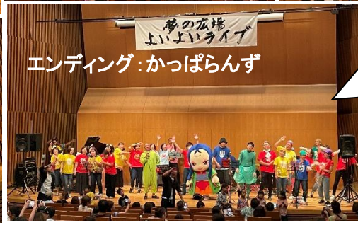
エンディング:かっぱらんず