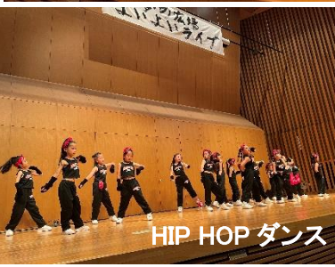
HIP HOP ダンス