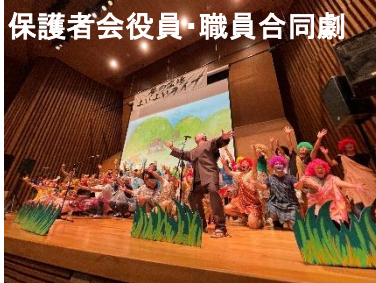
保護者会役員・職員合同劇