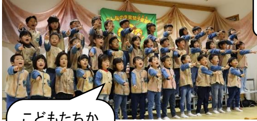
こどもたちからは、「思い出のアルバム」をアレンジした、歌と言葉のプレゼントもありました。

式典後には、保護者さん主催による「ありがとうの集い」が開催されました。お忙しい中、委員の方を中心に様々な準備、企画運営をしてくださいました。本当に心のこもった時間を、ありがとうございました！