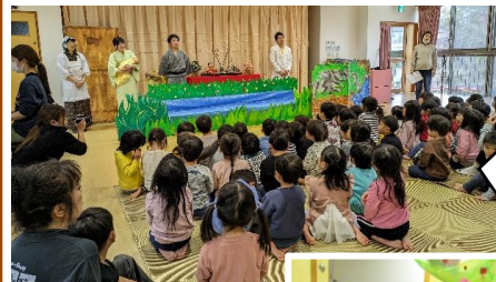
2歳以上児さんは、劇を通してひなまつりの由来について触れました。