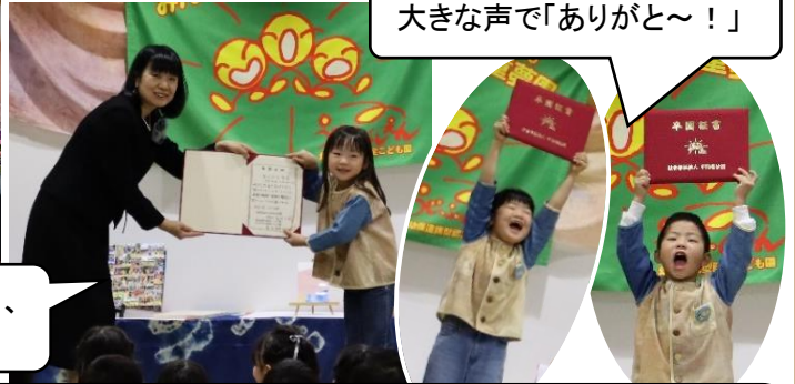
大きな声で「ありがと～！」