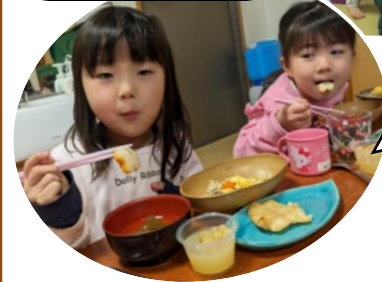
桃の花をイメージして型抜きされた人参や、花魁など、行事ならではの特別感のある昼食も堪能！