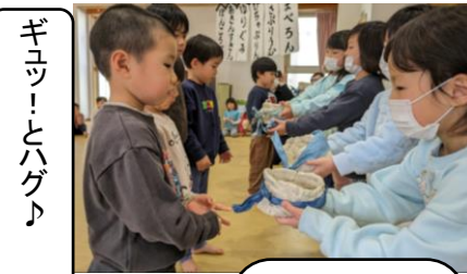
毎年恒例、ゆりぐみさんからふじぐみさんへの制服引き継ぎ式。年長さんだけが着れる特別な制服。嬉しそうに袖を通して鏡でチェック！