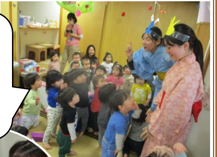
未満児さんは、職員がお雛様、お内裏様に扮した姿に興味津々！ひなまつりをイメージしたコーナー遊びを楽しみました。