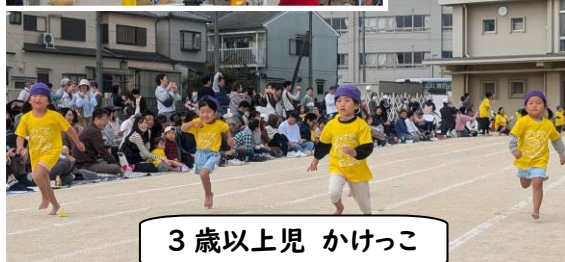
3歳以上児 かけっこ