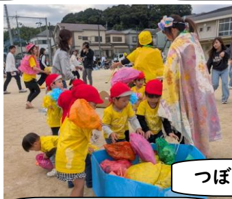
つぼみぐみ・ももぐみ親子競技