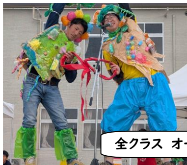
全クラス オープニング

天候の心配などありましたが、第5回みんなのき三山木こども園・みんなのきねーねの運動会が、無事開催されました。今年のテーマは「あそびめ むすびめ ねねねのめーちゃん」。真剣な表情で挑戦する姿、伸び伸びと風を切って走る姿、保護者の方と一緒にふれあいを楽しむ姿など、いくつもの“め”や“ね”が伸びてゆく様子を感じていただけましたでしょうか？プログラムの変更などありましたが、スムーズな運営へのご協力ありがとうございました。