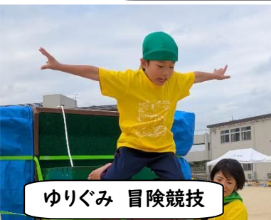
ゆりぐみ 冒険競技