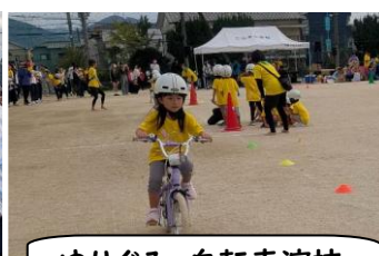
ゆりぐみ 自転車演技