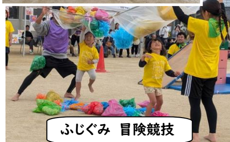
ふじぐみ 冒険競技