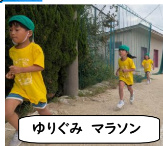
ゆりぐみ マラソン