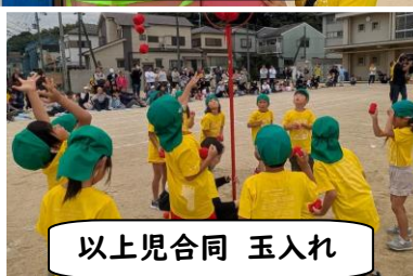
以上児合同 玉入れ