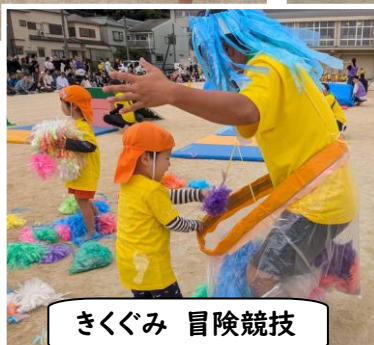
きくぐみ 冒険競技