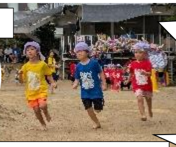
ゆり：竹馬・みこし・バチ打ちなど